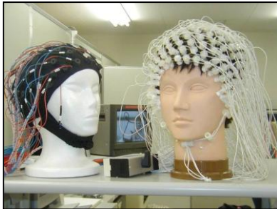
Casques d'enregistrement pour l'EEG

Dans certains laboratoires spécialisés, l'enregistrement EEG est couplé à une caméra permettant de filmer le patient, de manière à relier directement les anomalies du tracé aux manifestations cliniques du patient, et ainsi mieux comprendre le type de crises d'épilepsie présenté.