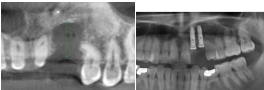
Perte de 2 dents et de l'os alvéolaire après un traumatisme. Greffe osseuse et 2 implants